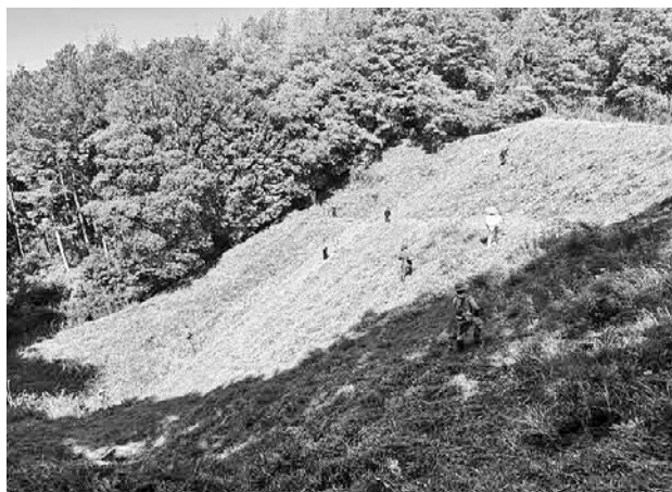
急斜面での草刈りは大変な作業

〔連絡先〕 産業振興課 ☎728-2134 Eメール：sangyoshinko@town.kumenan.lg.jp