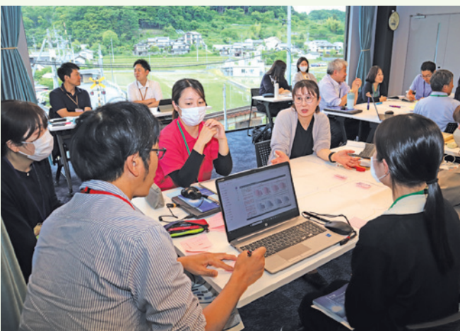
少子化対策について議論を深めるメンバー

町では、深刻化する少子化への対策に向け、全庁的な視点から分野横断的な議論を行うためのプロジェクトチームを立ち上げました。令和9年度予算編成に向け、統計データの分析に加え、住民や企業、町職員へのヒアリングを通じて現場の「生の声」を収集し、データと理論に基づいたエビデンス重視の施策立案を行っていく方針です。