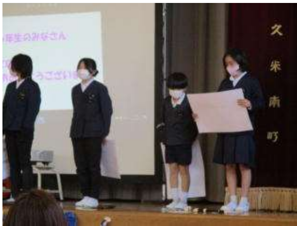
○4年生から メッセージと プレゼント リコーダー奏