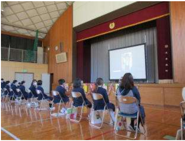
○スライドショー（5年生より）