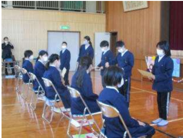
○1年生の時から楽しい写真がいっぱいで、全員がくいいるように見えていました。