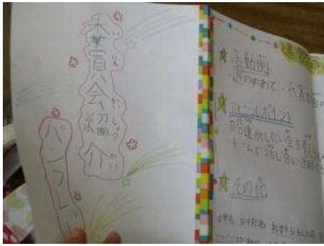
←委員会パンフレット

〇いよいよあと1ヶ月ほどで、4年生になり、委員会活動に参加します。6年生が委員会活動をまとめた「委員会パンフレット」を3年生のために作ってくれました。