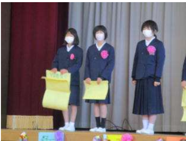
○6年生から全学年に川柳のメッセージと色紙をプレゼントしてくれました。