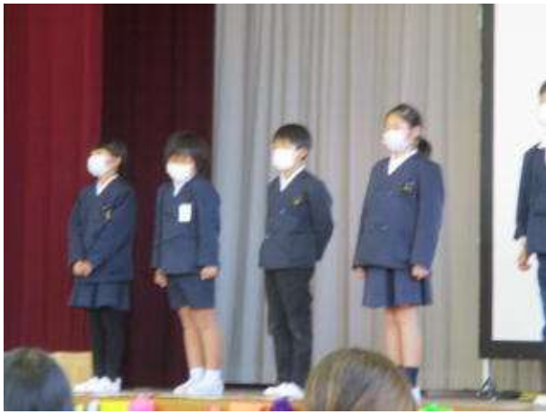
○3年生から 名前を使ったメッセージと プレゼント