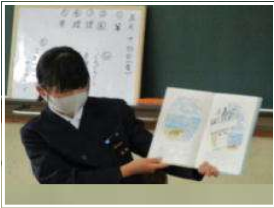
3年「ノラネコぐんだん そらをとぶ」