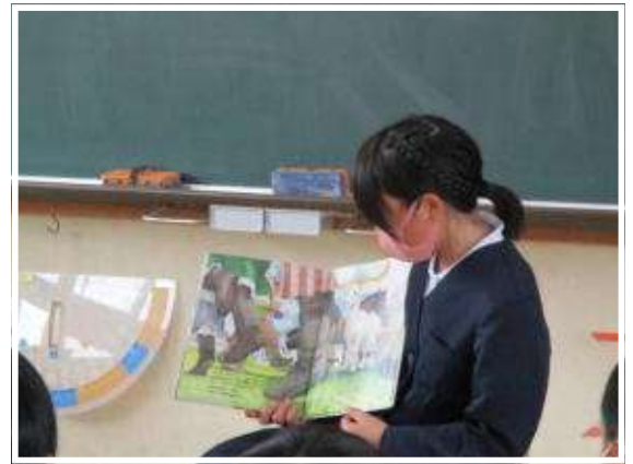
4年「ころべば いいのに」「ねんどぼうや」