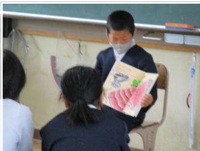
5年「にくのくに」「ねこは るすばん」