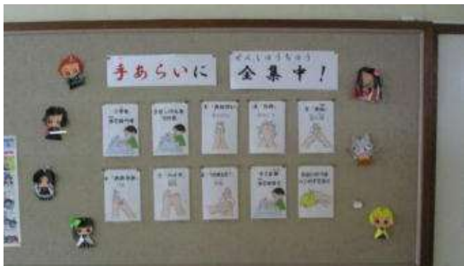
○手洗い指導（桂先生作） 給食室横