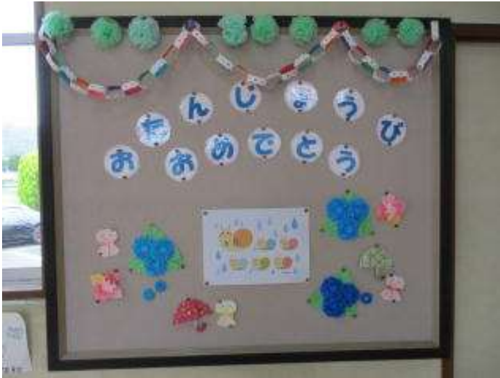
○6月のお誕生日掲示 給食室横