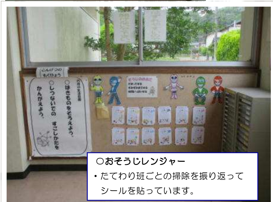
○おそうじレンジャー ・たてわり班ごとの掃除を振り返ってシールを貼っています。