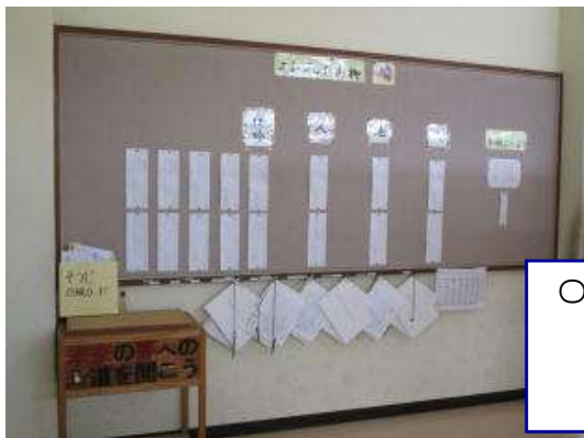
○エンジョイ川柳 図書室前廊下 今のお題は「弁当」です。