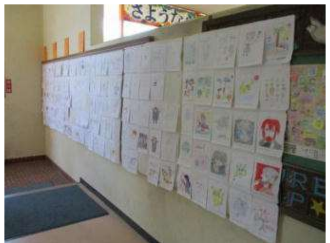
↑ イラストも こんなにたくさんの方が出して くれました。