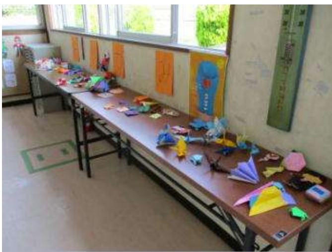
↑ たくさんの作品があります。 ていねいに折ってあります。

○今朝の全校朝の会では、各学年の「目標の反省」 図書委員会から「新しく入った本の紹介」 運営委員会から「折り紙コンテスト」「イラストコンテスト」の掲示について、それぞれ発表がありました。