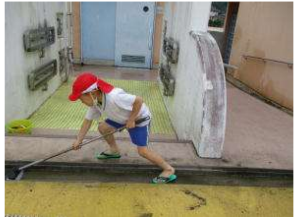
○溝までよく磨いている2年生