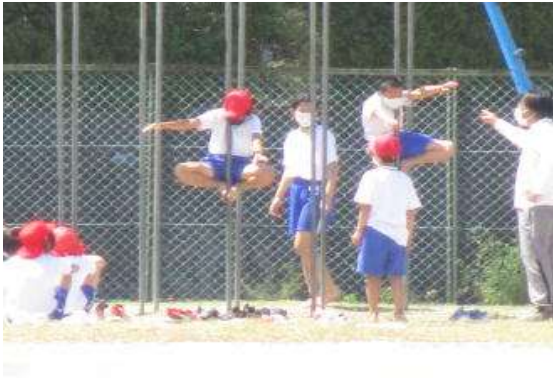
「サーカス」足だけでつかまり、両手を横に広げ、10秒