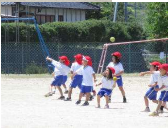
○月曜日の体育の時よりも 遠くに投げられた人がいました。