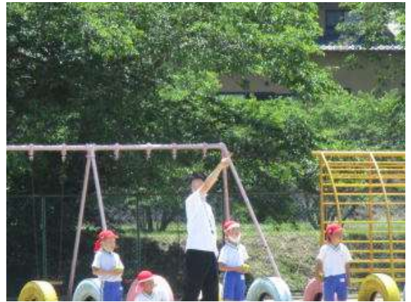
○「体育館の屋根を越えるような向きに投げます」