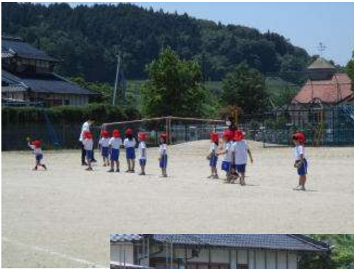
○1・2年体育では、50m走やソフトボール投げの練習をしています。