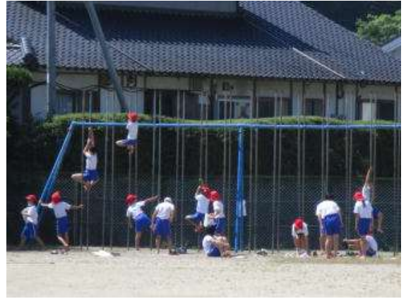
○のぼり棒は「木のぼり しゅぎょう」です。