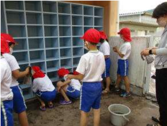
更衣室やくつ箱 トイレなどは3年生の担当です。