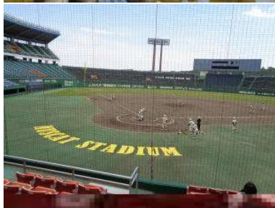
○公園内にはマスカットスタジアムがあります。