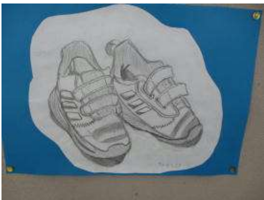
○5年 図工 クロッキー