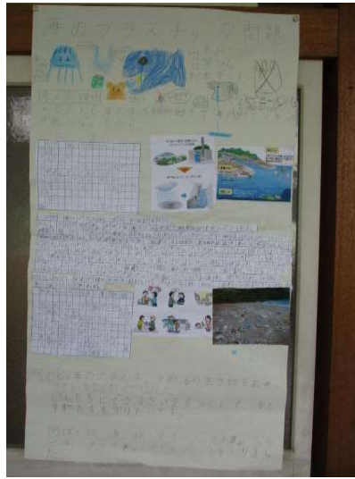
「海のプラスチック問題」