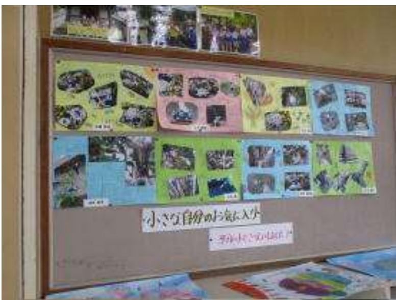
3年 図工「ちいさな自分の お気に入り」