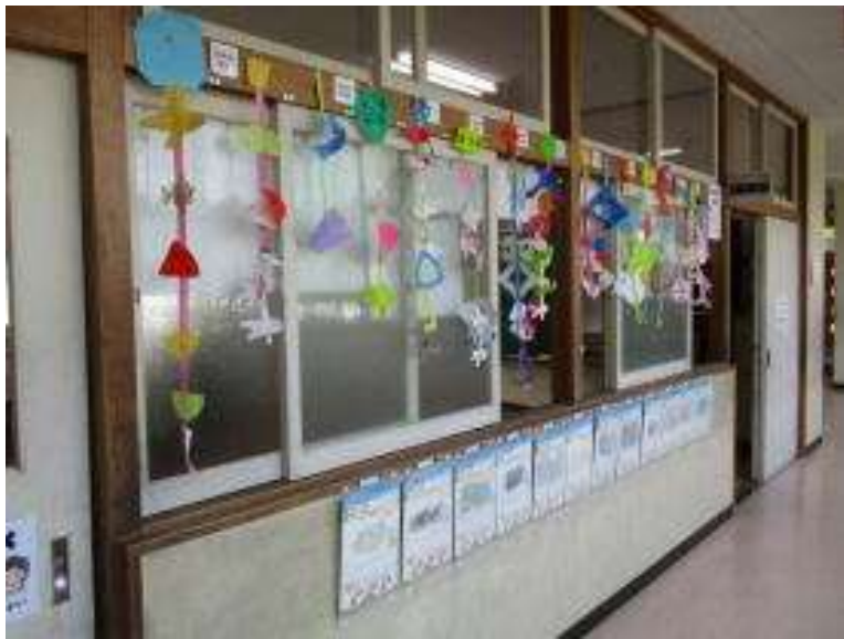
○1年 図工 「ちょきちょきかざり」