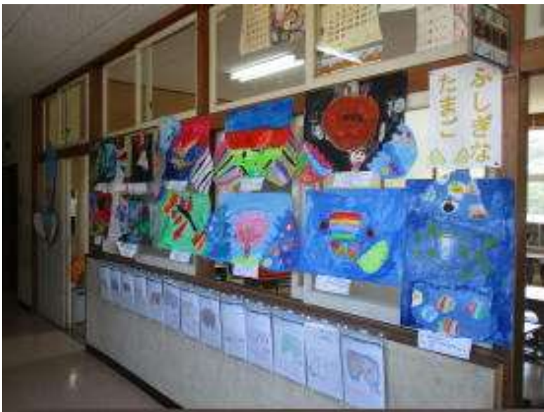
2年 図工「ふしぎなたまご」