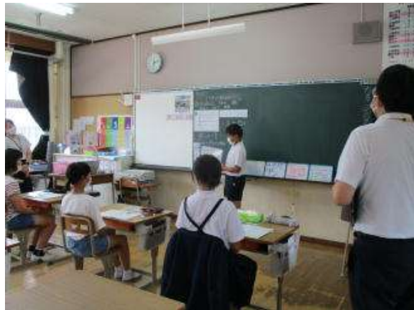
6年 「分数の わり算」