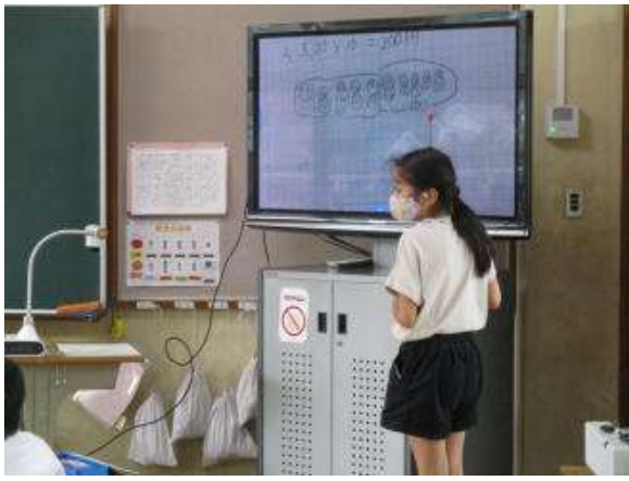
3年 「一万を こえる数」

○「めあての立て方の工夫」「関わり合いの工夫」「振り返りの工夫」の三本柱で指導を深めます。