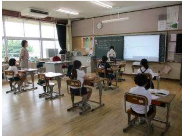
4年 「一億を こえる数」

○「めあての立て方の工夫」「関わり合いの工夫」「振り返りの工夫」の三本柱で指導を深めます。