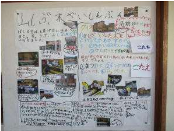
「山しび木ざいしんぶん」 (山茨木材新聞)