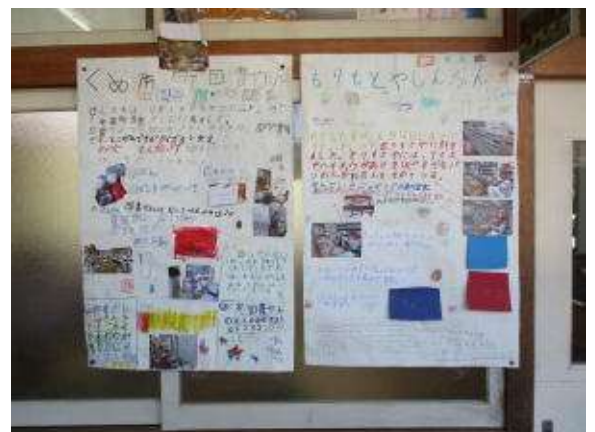
「くめ南町図書かん」(久米南町図書館)