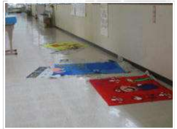
6年 応援の旗を製作中