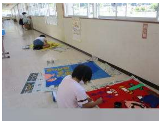
○運動会に向けて、体育の時間以外にも力を発揮する場があります。