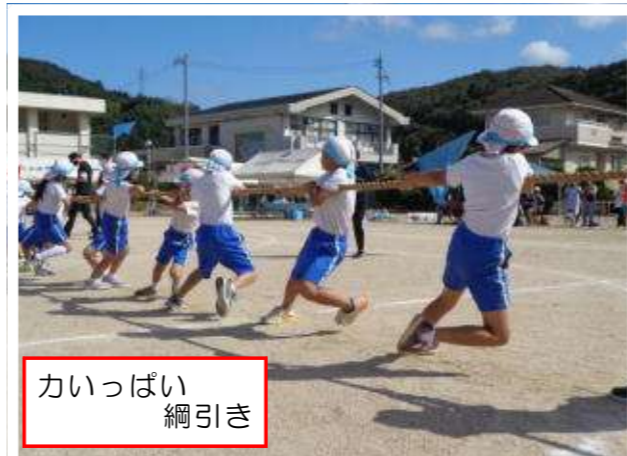
かいっばい 綱引き