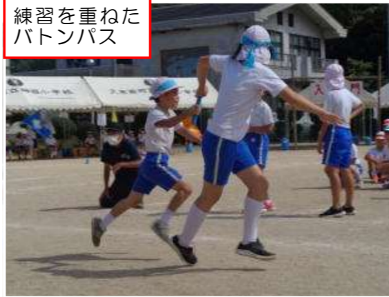
練習を重ねたバトンパス