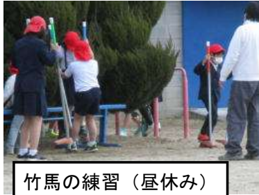
竹馬の練習（昼休み）

「全校朝の会」など、全員が一堂に会する行事ができない状況の中、6年生が番組を作成し、各学年に校内配信しています。「ロクナンデス」を見るのをどの学年の人も楽しみにしています。こま回しやあやとりなどの「昔あそび」を教えてあげたり、竹馬の上手な乗り方を紹介したり