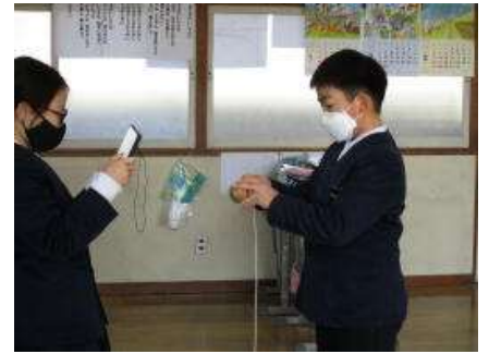
「こまのひものつけ方」の収録

「今できることを考えて積極的に取り組む姿」は、下の学年のよい手本です。この後も、6年生や5年生を中心に、分散して行う行事の計画などもあります。