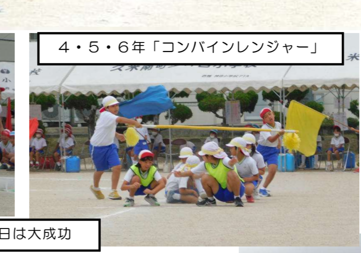
4・5・6年「コンバインレンジャー」