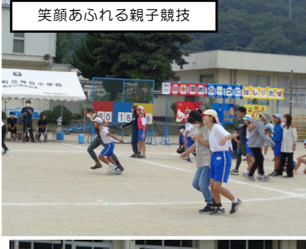
笑顔あふれる親子競技