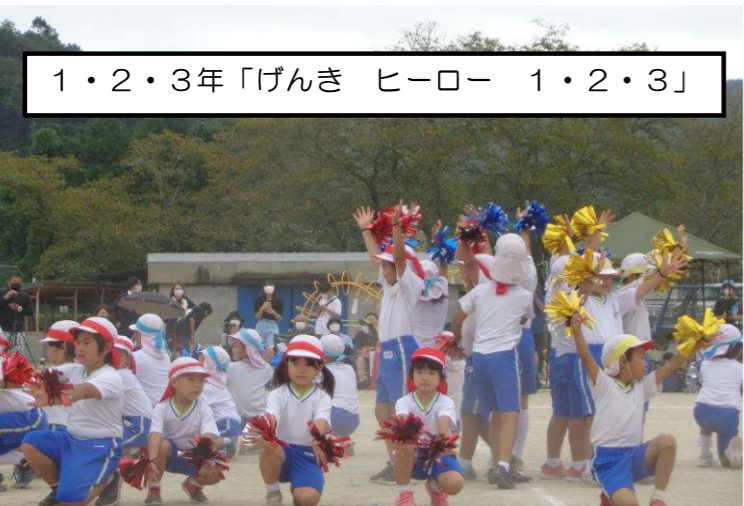
1・2・3年「げんき ヒーロー 1・2・3」