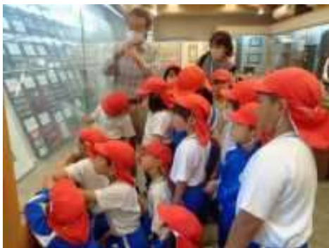
低学年【津高郵便局、坂野記念館、池田動物園】

5月26日（金）に低学年・中学年・高学年ごとに校外学習に行きました。学校ではできない様々な体験的な学習をすることができた、充実した1日となりました。