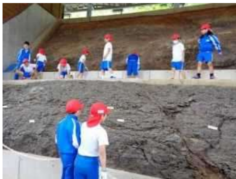
中学年【なぎピカリアミュージアム、ノースビレッジ】