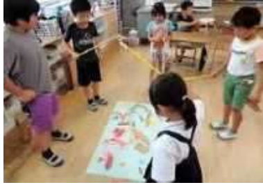
【3年生】さかなつり、めいろ

6月28日(水)に「神目祭」が開催されました。児童会の運営委員会が「全校のみんなとふれあい、仲良く楽しく学校生活を送るために」と提案したものです。3～6年生が「店」を出し、全校で様々な出し物を楽しみました。約1時間の活動でしたが、とても楽しそうに参加している姿が印象的でした。