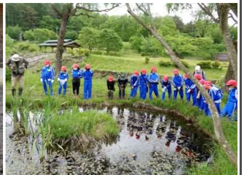
高学年【津黒いきものふれあいの里】