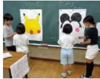
【4年生】ふくわらい、まとあて