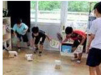
【6年生】パタパタカーレース、中身当てゲーム