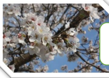
久米南中学校校門前の桜(令和8年4月4日)