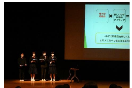
2年生の発表の様子です。