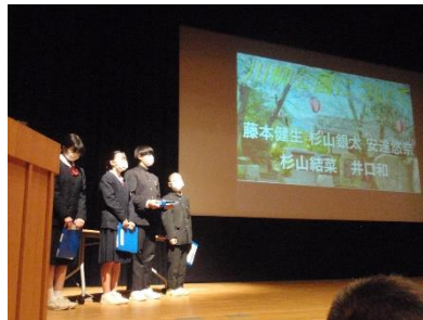
1年生の発表の様子です。