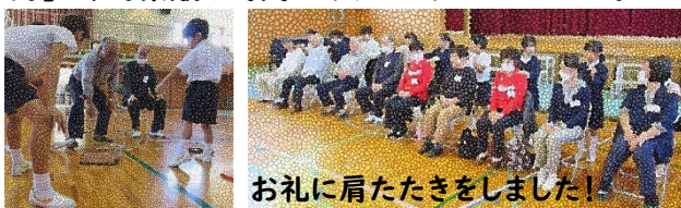
お礼に肩たたきをしました!

老人クラブの皆様が、昔遊び(コマ回し・メンコ・剣玉・お手玉・あやとり)を教えてくださいました。匠の技に憧れながら、子どもたちは集中して楽しみました。来年度上学年になる3年生からは「来年もしたいなあ。」の声。素敵な時間をありがとうございました。