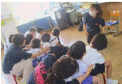
6月19日(水)1年生 一緒にゲームや手遊びをしたよ。手 つないでバスまでお見送りをしたよ。