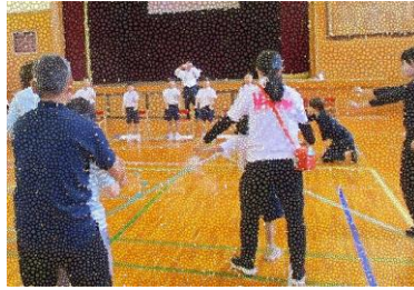
6月5日(水)3年生 自分たちが考えた振付をしながら の歌やリコーダー奏を披露したよ。