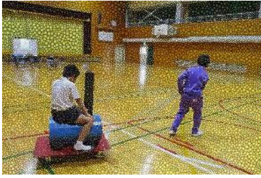
5月31日(金)4年生 グループごとに支援学校を探検して プレイルームや体育館で遊んだよ!