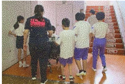
6月20日(木)6年生 グループごとに小学校を探検し ながらキャラクターを探したよ!