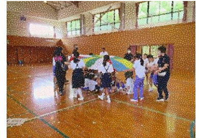
6月21日(金)5年生 ダンスを披露して、一緒にゲー ムやバルーンを楽しんだよ。