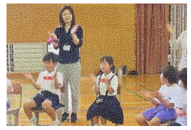
6月12日(水)2年生 音楽に合わせて楽器を演奏し たよ。バルーンも楽しかったよ。