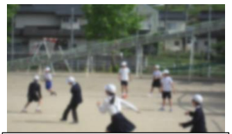
異学年でドッチボールを 楽しむ子どもたち

4月30日から、長いお休みがありました。お仕事をされながら、ご家庭でお子さんの生活を支えることは大変だったと思います。特に、家庭学習の計画や、ゲーム時間の管理など発達段階に応じたご苦労があったと思いますが、いろいろ工夫してくださったことに感謝いたします。自分で時間割を作ったり、お手伝いを頑張ったり、自分を律しながら規則正しい生活を心がけた子どもも多くいたようです。おかげさまで長い休み明けではありましたが、どの学年も落ち着いて学習に取り組んでいます。ほとんどの日が欠席0で、子どもたちは元気に学校に登校してきています。