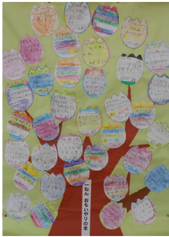
1年生 思いやりの木

6月5日～11日は、「いじめについて考える週間」です。本校でも、にこにこ相談期間中に、「思いやりの木」と「思いやり川柳」に取り組みました。「思いやりの木」は、各学年に木の幹を描いた模造紙を掲示し、「友達にしてもらってうれしかったこと」などを書いて貼っていきます。だんだんと友達の良さを認め、友達が喜ぶことをしていこうという気持ちが高まり、「思いやりの木」がたくさんの花や葉っぱで茂っていきました。自分の良さを友達から認めてもらうことで、自信が付き、自己肯定感を高めることにもつながります。