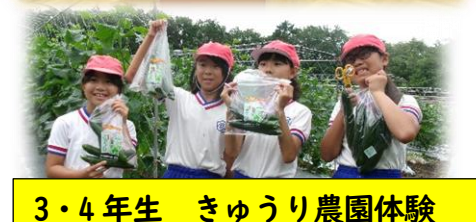
3・4年生 きゅうり農園体験