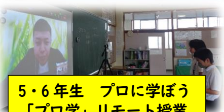
5・6年生 プロに学ぼう「プロ学」リモート授業