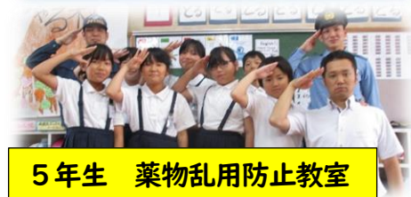
5年生 薬物乱用防止教室