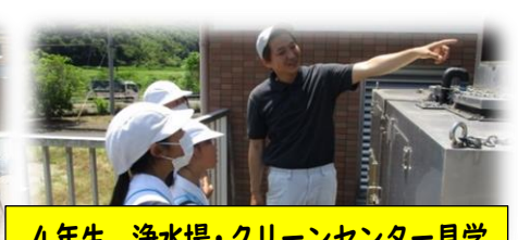
4年生 浄水場・クリーンセンター見学