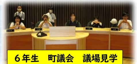
6年生 町議会 議場見学