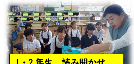
1・2年生 読み聞かせ