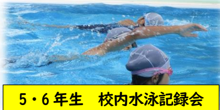
5・6年生 校内水泳記録会